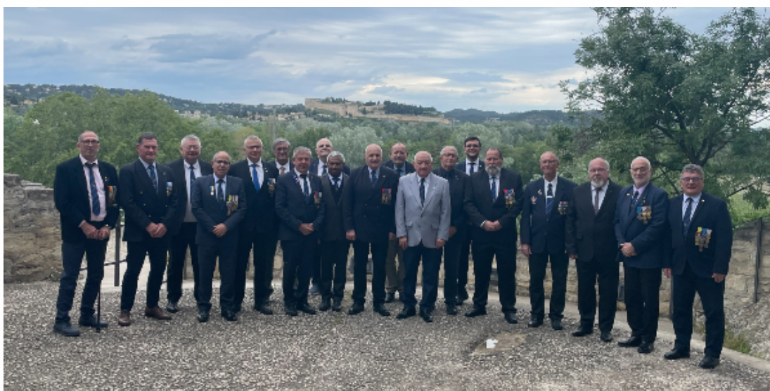
Nouveau conseil d'administration

Résultats des votes qui se sont déroulés à Avignon lors du Congrès, les 25, 26 et 27 avril 2024